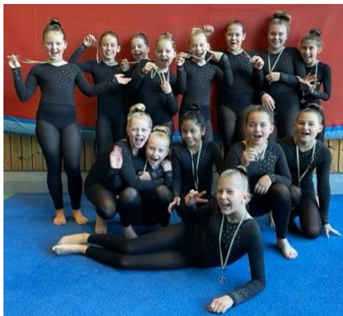
Trupp 11 - Huddinge Trupp Cup, November

SGF har representerats på flera roliga tävlingar runtom i Sverige, med fina framgångar. Här kommer några exempel: